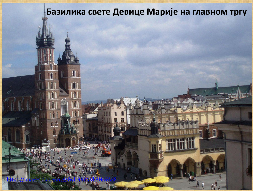
Базилика свете Девице Марије на главном тргу

https://images.app.goo.gl/dKXwJn1ce5sUhd7