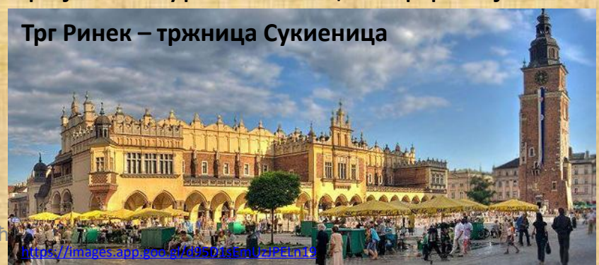
Трг Ринек – тржница Сукиеница

https://images.app.goo.gl/0D5715em0ZPEm13