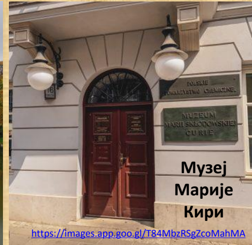
Музеј Марије Кири

https://images.app.goo.gl/V6cTWmfax9y8ESN97