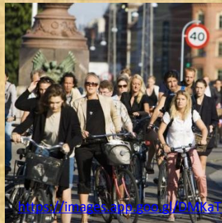
Бицикли Мала сирена

https://images.app.goo.gl/20a1ysu9MP22Rv597