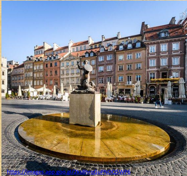
Краљевски замак горе, десно, и статуа сирене заштитнице града доле

https://images.app.goo.gl/2K2dy7sUjRf6zW66